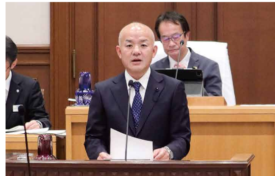
質問と答弁のダイジェストは中面へ続く▶