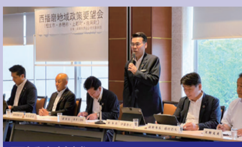
西播磨地域 相生市・赤穂市・上郡町・佐用町 2023年6月22日 赤穂市で開催