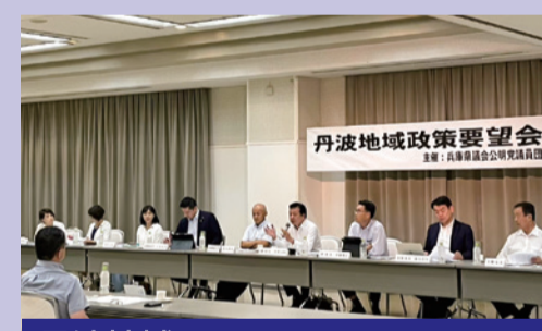
丹波地域 丹波篠山市・丹波市 2023年7月12日 丹波篠山市で開催

県議会公明党は、2000年から毎年夏に公明党議員のいない地域へ訪問し、直接各市町長及び地元公明議員から県政への要望、意見をお聞きする「地域政策要望会」実施しています。令和5年度は