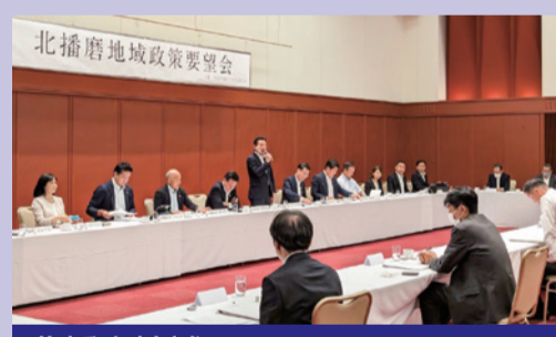
北播磨地域 西脇市・三木市・小野市・加西市・多可町 2023年6月22日 三木市で開催