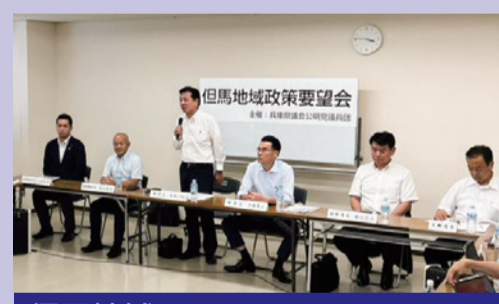
但馬地域 豊岡市・養父市・朝来市・香美町・新温泉町 2023年7月11日 豊岡市で開催