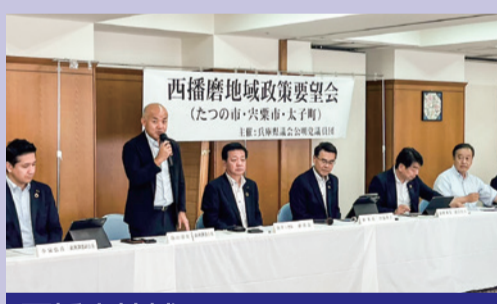
西播磨地域 たつの市・宍粟市・太子町 2023年6月23日 たつの市で開催