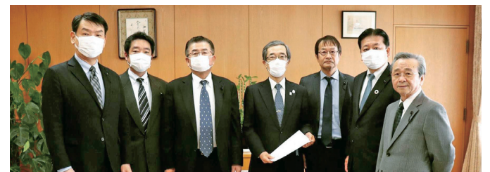
公明、自民、ひょうご県民連合3会派での申し入れ

県内の公立学校は3月から全て休校となっていました。しかし、県教育委員会が新学期の始まる4月から学校再開する方針を発表したところ、保護者の方から不安や不満のお声を非常に多く頂戴しました。感染状況も深刻であることを踏まえ、公明、自民、ひょうご県民連合の3会派で、知事に対して学校再開は時期尚早であり休校を継続するよう緊急に申し入れを行い、休校が継続することになりました。