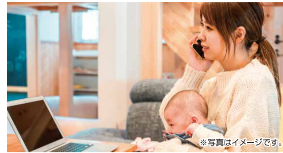
※写真はイメージです。