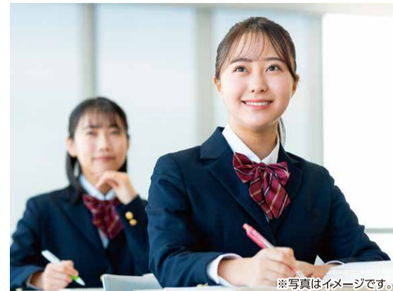
※写真はイメージです。