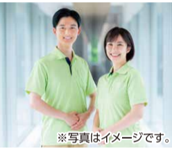
※写真はイメージです。

対象者 グループホームの責任者(管理者等) 世話人・生活支援員などの直接処遇職員 お問合せ先 福祉部障害福祉課 TEL.078-362-9105