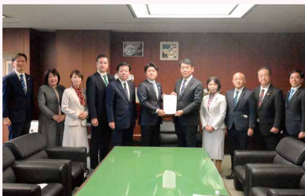
中野洋昌 国土交通大臣