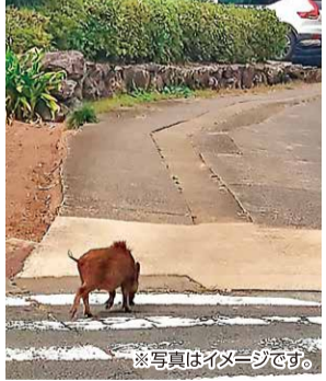
※写真はイメージです。