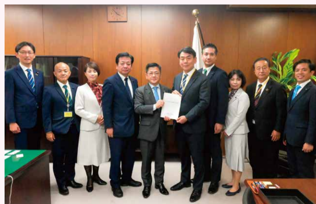
庄子賢一 農林水産大臣政務官