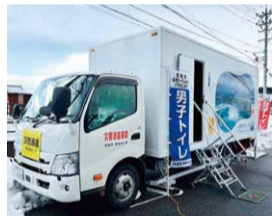
南あわじ市で導入された 自走式水洗トイレカー(参考)