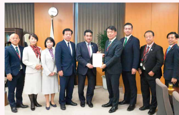
坂井学 内閣府特命担当大臣(防災、海洋政策)