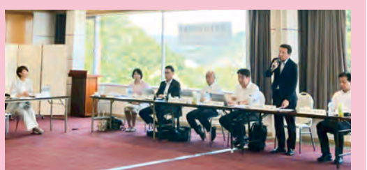
西播磨地域 相生市・赤穂市・上郡町・佐用町 令和7年8月22日(午後)開催