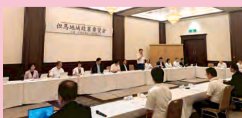
但馬地域 豊岡市・養父市・朝来市・香美町・新温泉町 令和7年8月20日開催