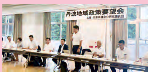
丹波地域 丹波篠山市・丹波市 令和7年8月4日開催

兵庫県議会公明党議員団は、2000年から毎年夏に、県議がいらない地域を訪問し、市町長・議会議員の皆様と率直な意見交換を行う「地域政策要望会」を実施しています。令和7年度は、丹波・但馬・西播磨の3地域4か所で開催。いただいた声をもとに政策提言を行い、令和8年度予算に反映されるよう、知事に対し予算要望を行いました。