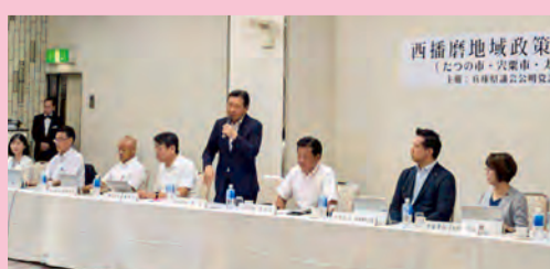
西播磨地域 たつの市・宍粟市・太子町 令和7年8月22日(午前)開催